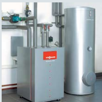
Пример установки теплового насоса Vitocal с емкостным водонагревателем Vitocell.

Тепловые насосы от Viessmann награждены знаком высокого качества и экологичности.