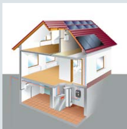
Комплексное применение энергосберегающего оборудования Viessmann в загородном доме.